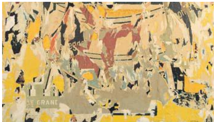
Mimmo Rotella , Senza titolo , 1960, decollage su tela, cm 53,5x94

Il tema che accomuna le loro creazioni, apparentemente molto diverse e distanti, sia nello stile che nella stessa concezione estetica, è il rapporto con la realtà: I tre artisti rappresentano i molteplici indirizzi dell'arte moderna, che abbandona e supera il ruolo tradizionale dell'arte come imitazione della natura, per darle un nuovo ruolo e una nuova missione ... oltre l'immagine .