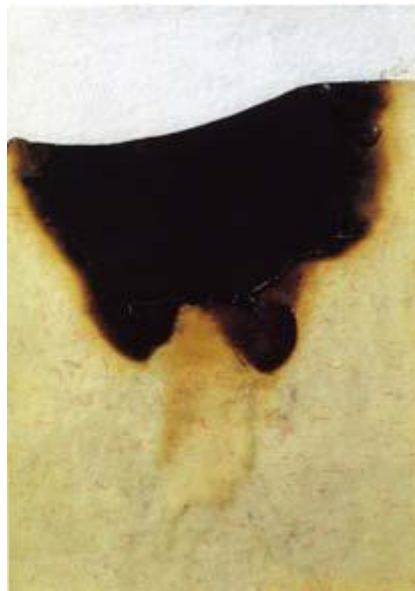
Alberto Burri , Combustione , 1978, acrilico, vinavil, combustione su carta, applicata su cartoncino, cm 17x12,2

La seconda opera, una Combustione , sviluppa il tema della metamorfosi in maniera analoga, utilizzando il fuoco, da sempre associato all'idea di una profonda e radicale purificazione spirituale.