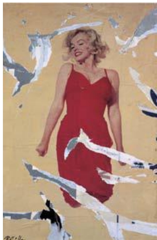
Mimmo Rotella , Salta Marilyn , 2005, decollage su tela, cm 67,5x44,6