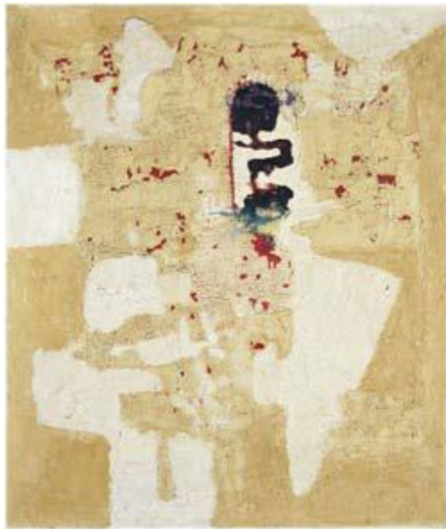
Alberto Burri , Muffa , 1951, acrilico, olio, smalto, bianco di zinco, pietra pomice e vinavil su tela, cm 65,2x55