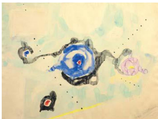
Lucio Fontana , Progetto per pavimento e mosaico , 1956, gouache su carta, applicata su tela, cm 64x85